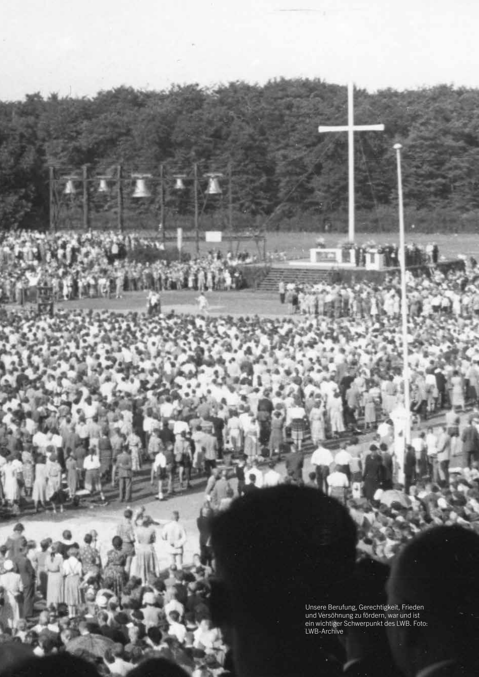
Unsere Berufung, Gerechtigkeit, Frieden und Versöhnung zu fördern, war und ist ein wichtiger Schwerpunkt des LWB.