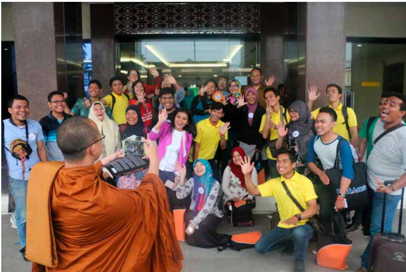
Teilnehmerinnen und Teilnehmer eines vom LWB unterstützten interreligiösen Projekts, das sich an junge Menschen in Indonesien richtet.

den strategischen Schwerpunkt der Advocacy-Arbeit des LWB für Klimagerechtigkeit. Der LWB setzt sich für politische Entscheidungen und Maßnahmen zum Schutz junger Menschen vor derzeitigen und künftigen Auswirkungen des Klimawandels auf ihr Leben und ihre Lebensgrundlagen ein und führt entsprechende Kampagnen durch. Außerdem setzt sich der LWB für die vollumfängliche Teilhabe junger Menschen an der Entscheidungsfindung bei Fragen des Klimawandels ein, auch dadurch, dass sie in die Lage versetzt werden, selbst Lösungen zu entwickeln. Der Standpunkt der Generationengerechtigkeit verstärkt die Stimmen der Leitungspersonen der LWB-Mitgliedskirchen, die ihre Positionen und ihren Einfluss zum Schutz künftiger Generationen einsetzen.