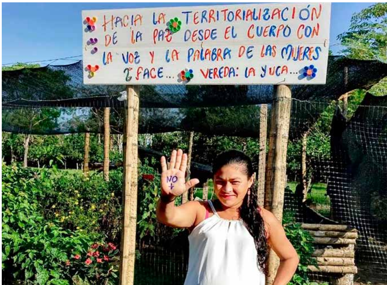
In Arauca (Kolumbien) verbindet der LWB Menschenrechtserziehung mit der Unterstützung von Lebensgrundlagen, um Frauen zu fördern.