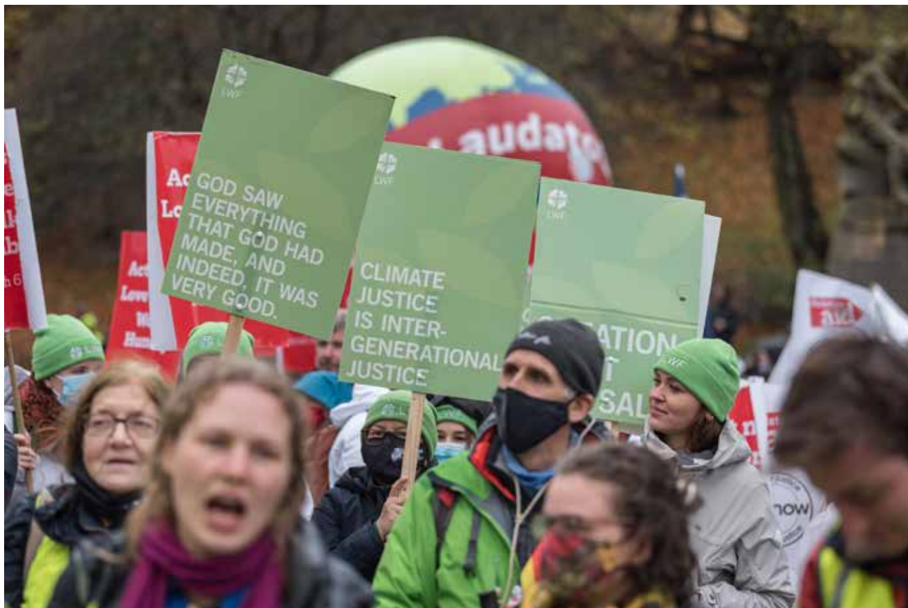
Delegierte des LWB nehmen beim Klimagipfel in Glasgow (Schottland) an Advocacy-Aktionen für Klimagerechtigkeit teil.

Der Klimawandel ist eine der größten Bedrohungen für das Leben, die Lebensgrundlagen, die Natur und den Planeten.